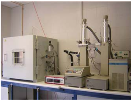
Instalación para la determinación de propiedades críticas utilizando el método de la opalescencia crítica

Termodinámica, Equilibrio Líquido-Vapor (ELV), Densidad, Compresibilidad, Puntos críticos, Velocidad del sonido, Alta presión, Extracción/reacción supercrítica, Modelización.