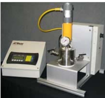
Equipo de reacción supercrítica