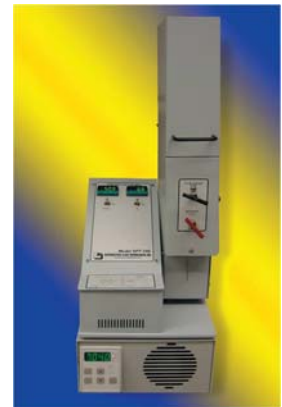
Equipo de extracción supercrítica