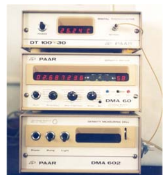
Densímetro Anton Paar de tubo vibrante